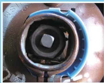
アセチレンガス容器