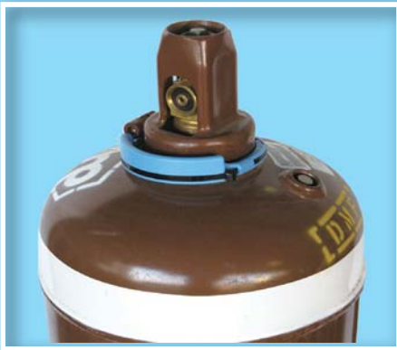
アセチレンガス容器