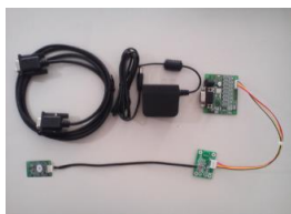
評価キット用基板

ARI3030評価キットをご用意しております。RS-232CまたはUSB接続で、FeliCa、Mifareの読み書きの動作確認、読み取り速度や性能について確認することができます。また、評価用ソフトウェアツールをご提供します。NFCコマンドリファレンスは、NXP社のウェブサイトからの入手となります。情報のダウンロード先については添付の資料に記載しています。