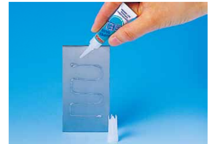
保存安定性に優れたアルミチューブ 2g.3g Excellent stability Aluminum tube type (NET.2g.3g)