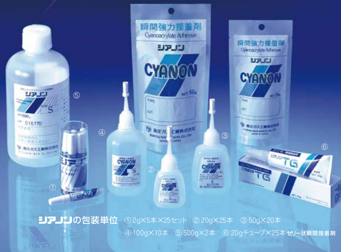
シヤノン®の包装単位 ① 2g×5本×25セット ② 20g×25本 ③ 50g×20本 ④ 100g×10本 ⑤ 500g×2本 ⑥ 20gチューブ×25本 ゼリー状瞬間接着剤