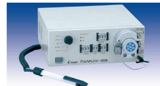
高機能タイプ Upgrade type