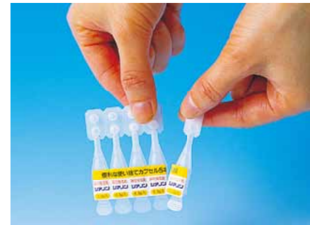
ミニボトル5連パック 0.5g×5 Stay fresh type (NET.0.5g×5pcs.)