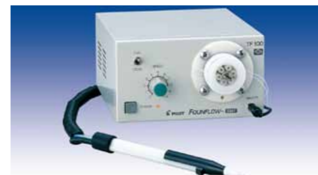
普及タイプ Standard type